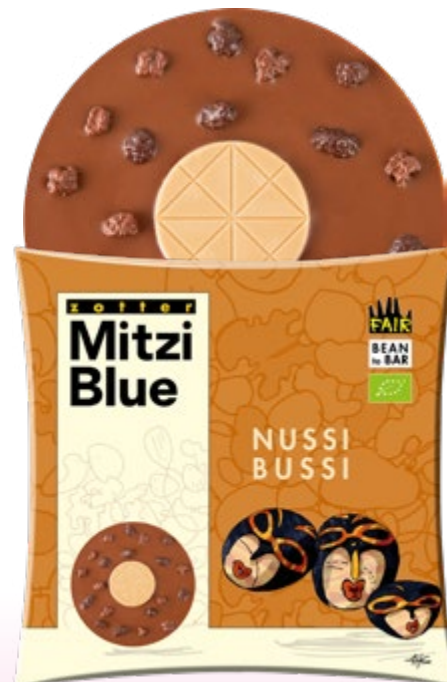
NUSSI BUSSI ART.-NR. 24130 Haselnussnougat + Cashewnougat + Nüsse

VE = 10 Stk. 70-g-Scheibe MHD: mind. 5 Monate ab Lieferung