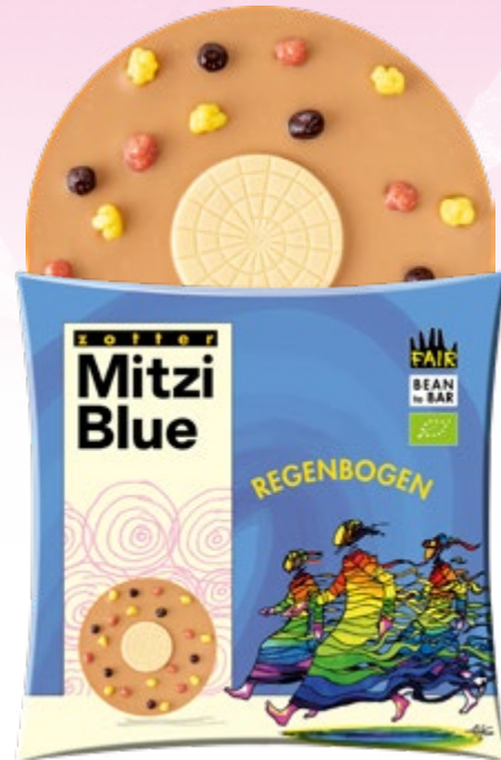
REGENBOGEN ART.-NR. 24177 Milchschoke + Weiße Schoko + Knusperfrüchte