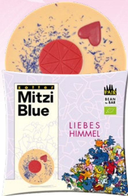
LIEBESHIMMEL ART.-NR. 24137 Weiße Schoko + Erdbeer + Himbeerherz