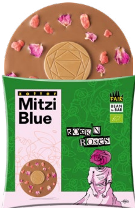
ROCK 'N' ROSES ART.-NR. 24176 Milchschoke + Nougat + Mandeln + Rosen